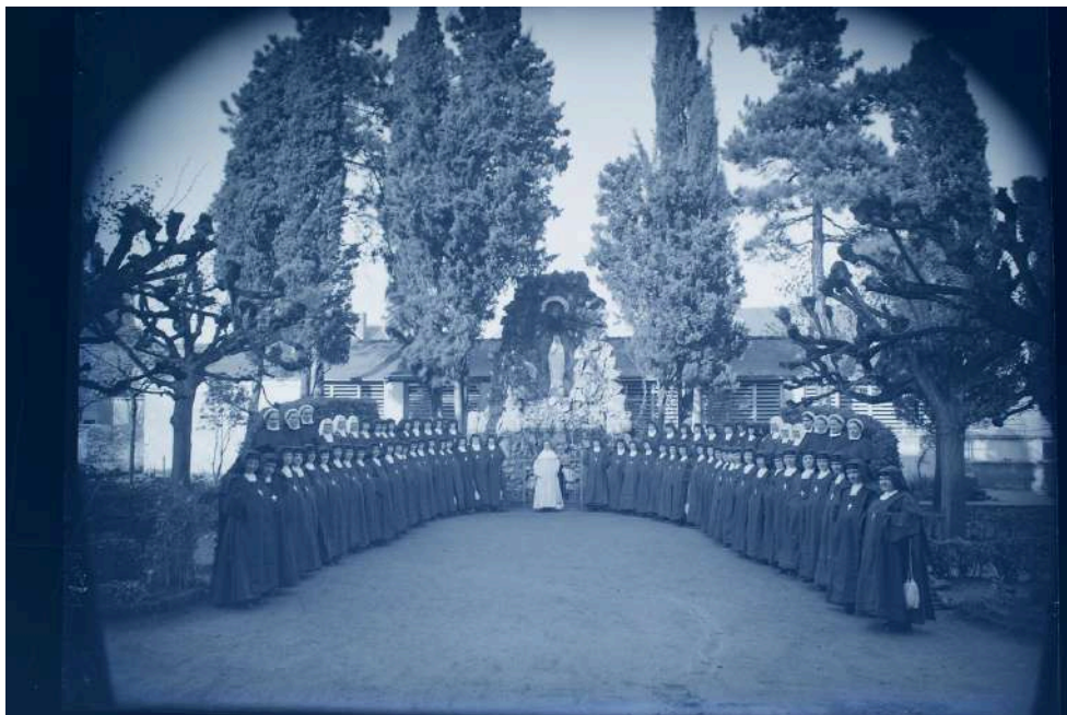
Angers, comunidad de las hermanas de Santa Magdalena, fotografía sobre placa de vidrio, [principios del siglo XX].

A finales del siglo XIX, se construyó en su patio una gruta dedicada a Nuestra Señora de Lourdes, que permaneció allí hasta el cierre de la última comunidad, en 2004.