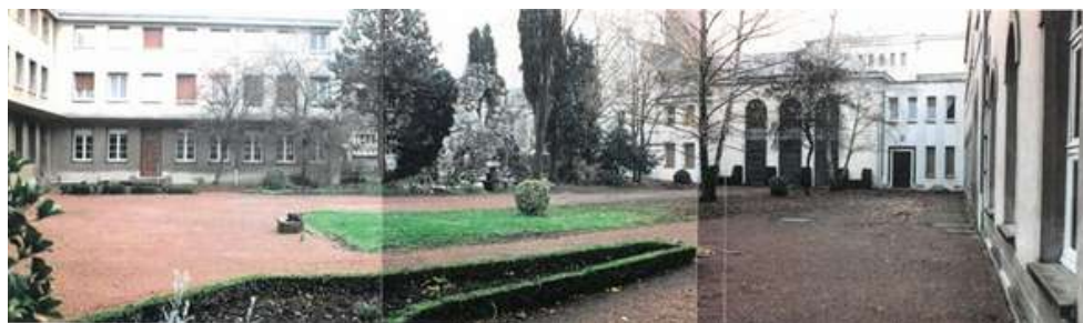
Angers, patio de la comunidad de las hermanas contemplativas, fotografía, 1992.

El patio fue demolido a finales de enero de 2007, durante las obras de construcción de la residencia Eufrosia Pelletier para personas ancianas.