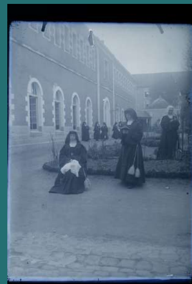
Angers, patio de recreo, fotografía sobre placa de vidrio, [principios del siglo XX].