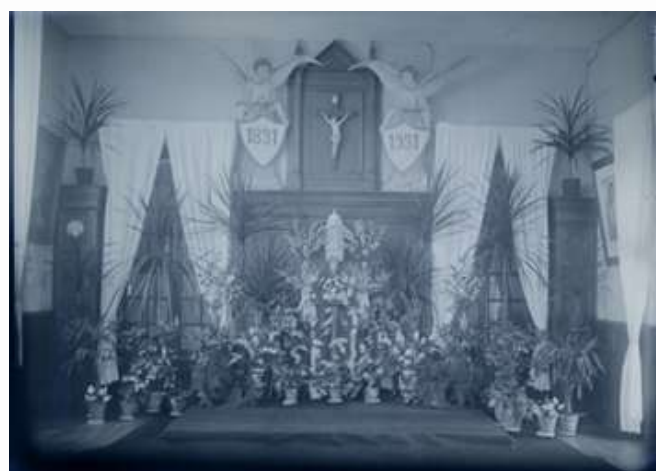
Angers, estatua de Santa María Eufrosia rodeada de flores con motivo del centenario, fotografía sobre placa de vidrio, [1931].

Puede descargar el texto íntegro del Boletín sobre este acontecimiento haciendo clic aquí.