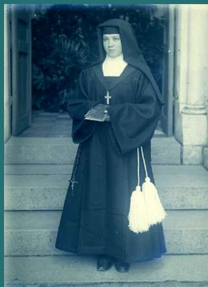
Angers, una joven profesada de Santa Magdalena, fotografía sobre placa de vidrio, [principios del siglo XXI].

La planta baja del edificio principal se construyó en 1846. La bendición de la primera piedra tuvo lugar el 13 de marzo, día de la festividad de Santa Eufrasia. Ese mismo año, el 4 de junio, se bendijo su nuevo coro en la capilla, del que aquí se muestra una vista.