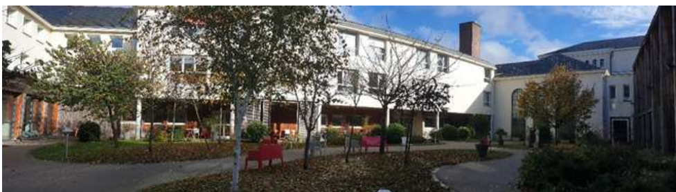
Angers, patio de la residencia Eufrosia Pelletier para presonas ancianas, noviembre de 2025.

El patio fue demolido a finales de enero de 2007, durante las obras de construcción de la residencia Eufrosia Pelletier para personas ancianas.