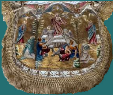
La capucha representa la Resurrección.