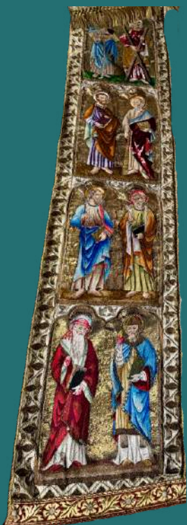
Los orfrois están copiados de bordados del siglo XIII procedentes de la colección del historiador de Angers Louis de Farcy.

Los orfrois (anchas bandas ricamente bordadas) están copiados de bordados del siglo XIII procedentes de la colección del historiador de Angers Louis de Farcy.